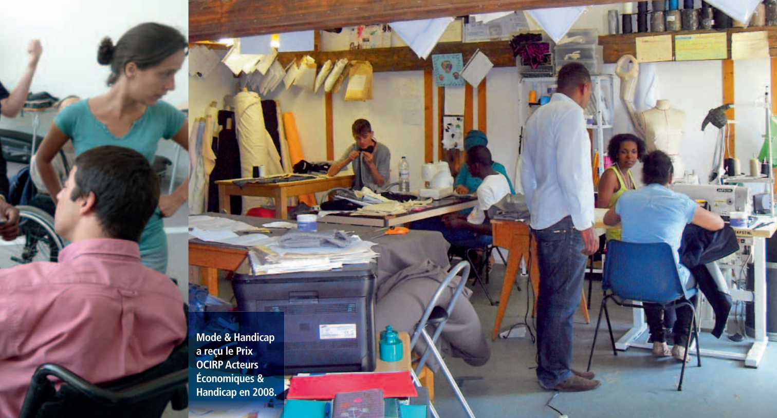
Mode & Handicap a reçu le Prix OCIRP Acteurs Économiques & Handicap en 2008.